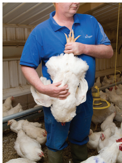
Рис. 3. Критерии оценки кондиции петухов, которые могут быть использованы для спайкинга.

Живая масса петухов для замены должна соответствовать нормативным показателям (3.9 - 4.1 кг / 8.5 - 9.0 фунтов). Как минимум, их средний живой вес и развитие скелета должны соответствовать параметрам особей в основном стаде, а физическое состояние (обмускуленность) быть хорошим (Рис. 3). Все петухи должны достигнуть зрелости, иметь полностью развитый гребень и сережки. Кроме того, у них должны быть хорошо развитые, прямые ноги, не искривленные пальцы и чистые, свободные от повреждений, ступни ног. Светостимуляцию этих петухов следует начинать минимум за 3 (в идеале 4 - 5) недели до перевода в более взрослое стадо.