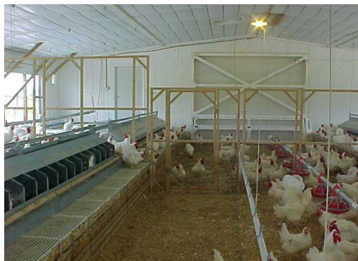
Рис. 1. Пример расположения отдельной петушиной секции в птичнике.

Перевод петухов в отдельную секцию в птичнике имеет свои преимущества, в частности возможность контролировать плотность посадки, параметры фронта кормления и световую программу. Это поможет воссоздать условия, сходные с теми, в которые петухи попадут после перевода к курам.